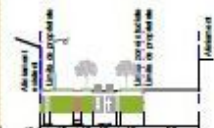
PROFIL 2-2 PRIN STR. ROGHELE PORUMBAN