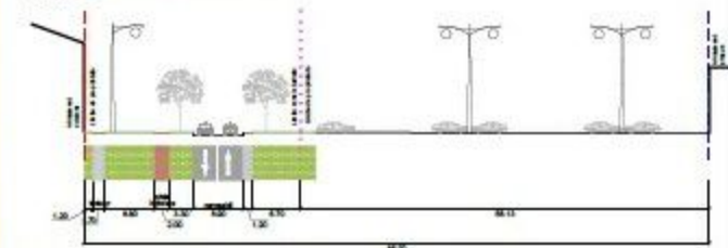
PROFIL 2-2 PRIN STR. REGELE FERDINAND SC.1:500