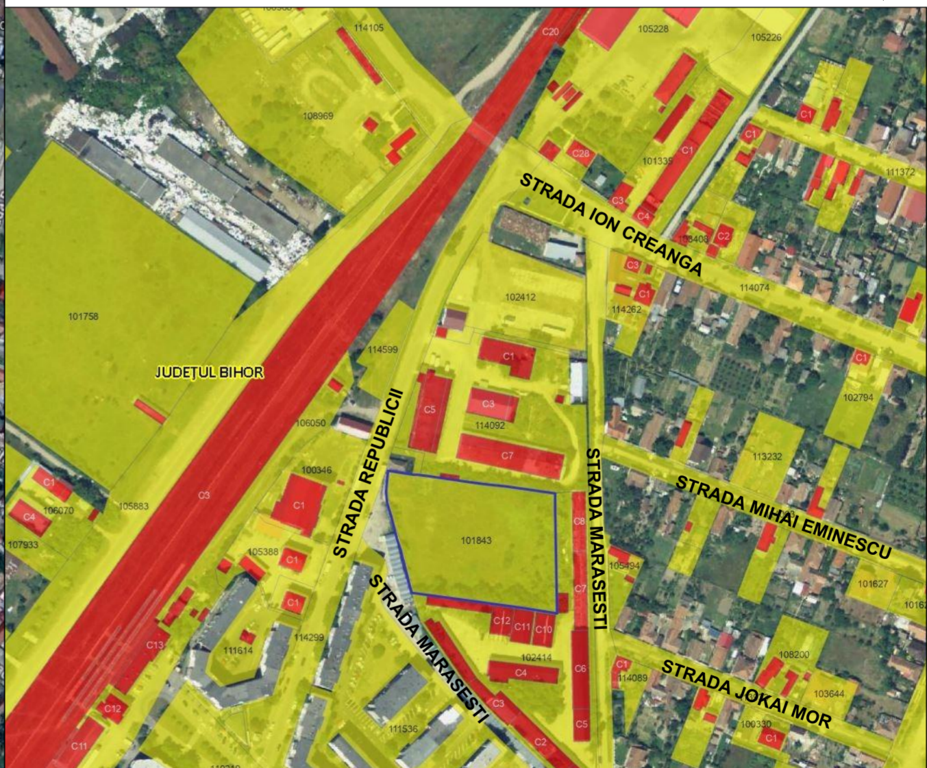
INCADRARE IN ZONA - extras din baza de date e-Terra

LICENTA ARCHICAD 128-18270045 SW000015030