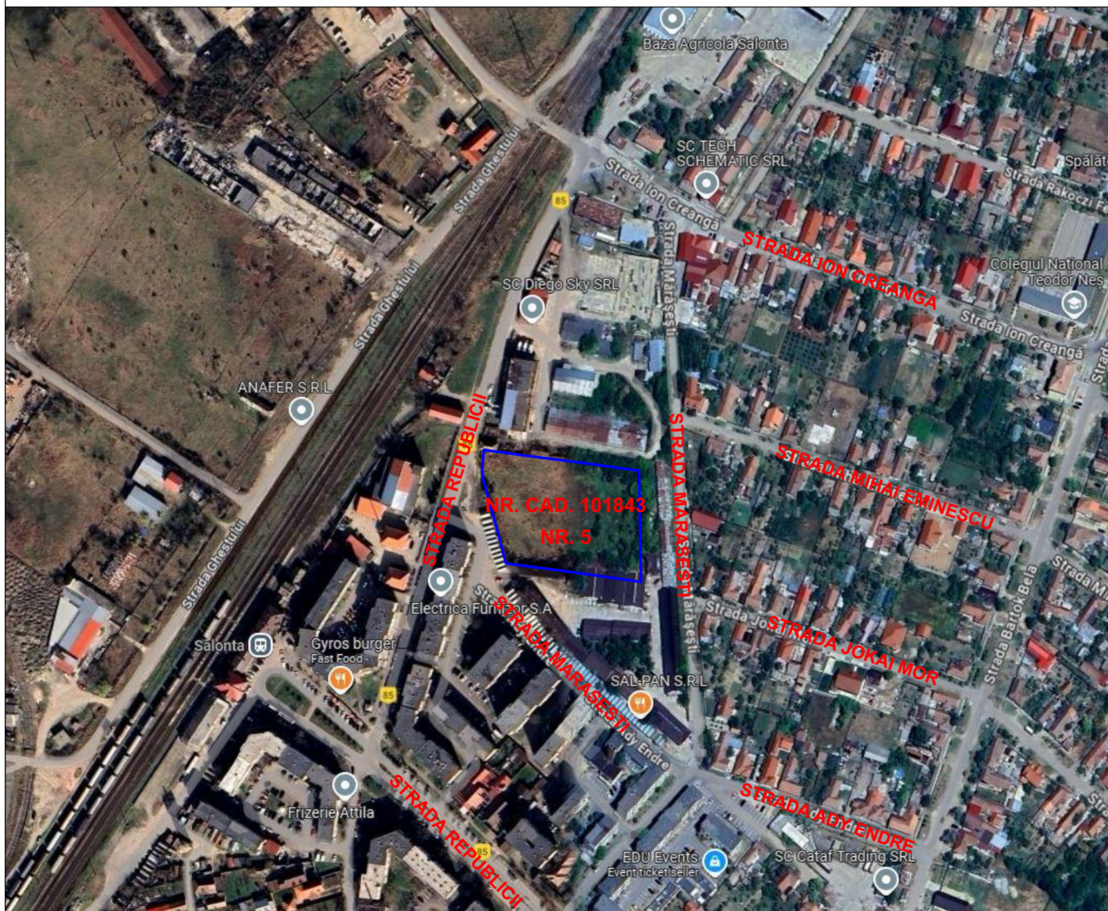
INCADRARE IN ZONA - ORTOFOTOPLAN